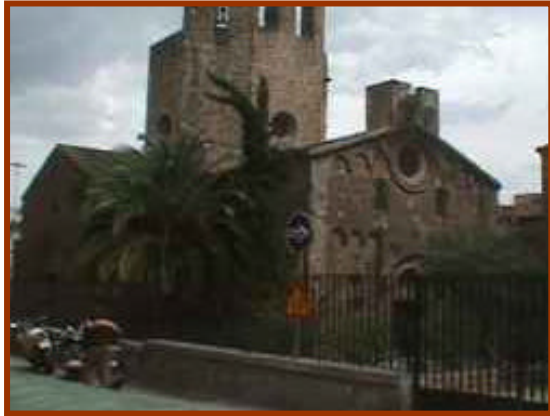
Il·lustració 3: monestir de Sant Pau del Camp.

La intervenció arqueològica efectuada als carrers Nou de la Rambla 10-12/Carrer Penedides 5-9, es troba en ple centre del barri del Raval, un dels punts d'interès