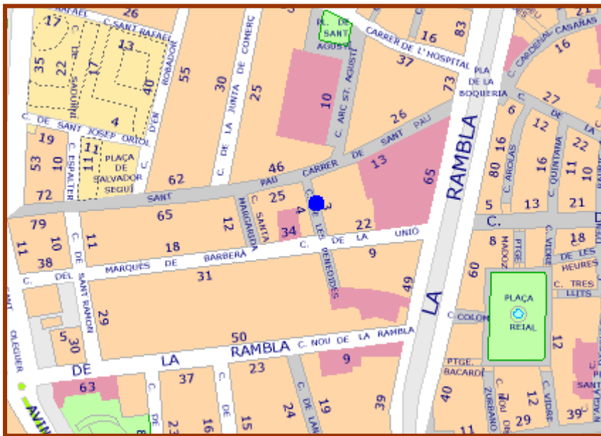
Il·lustració 1: mapa urbanístic de la zona a intervenir.